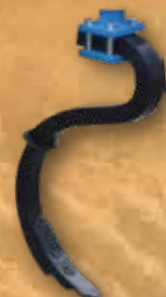
Federzinken 5 1/2 Lagen stabile Ausführung