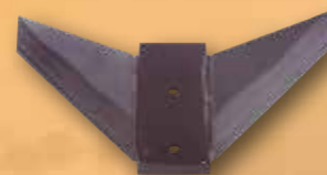
Flügelschar doppelt 400 oder 500 mm