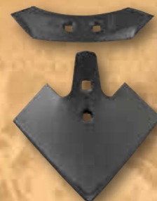
Kulti.-Gänsefus-schare in verschiedene Breiten