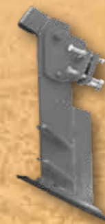
Tiefenlockerungszinken zum Tiefenlockern bis 45 cm