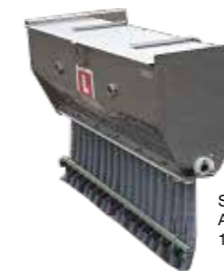
Sä-Kasten Arbeitsbreiten 1,00m / 1,20 m