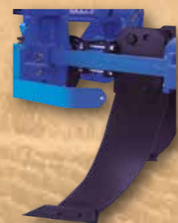
Parrazinken rechts oder links