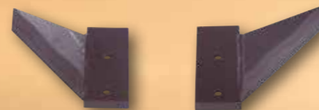
Flügelschar einseitig 400 oder 500 mm