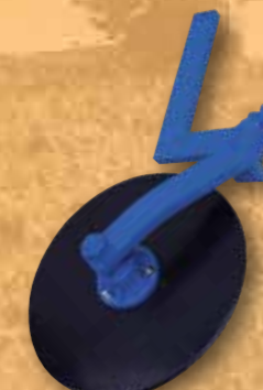
Pendelscheibensech ø 400 mm zum Vorschneiden