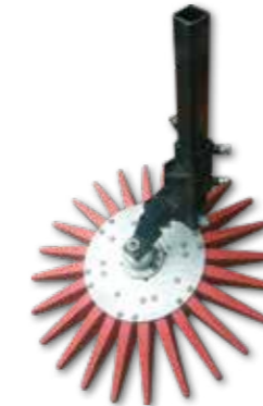
K.U.L.T. Fingerhacke in verschiedenen Durchmesser sowie in verschiedenen Härte Grade erhältlich mit Bodenantrieb.