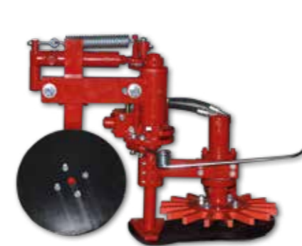
K.U.L.T. Fingerhackein verschiedenen Durchmesser sowie in verschiedenen Härte Grade erhältlich mit hydraulischen Antrieb.