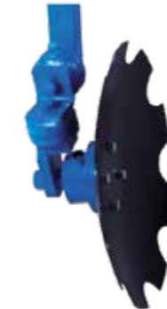
Hohlscheibe gewölbt 460 mm ø mit doppelter Verstellung passend für alle Scheibenpflug Modelle