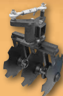
Scheibenwalze (1 Paar) mit 6 oder 8 Scheiben glatt oder gezackte Ausf. lieferbar