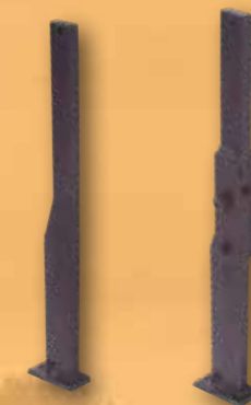
Tiefenmeißel mit oder ohne Steinsicherung